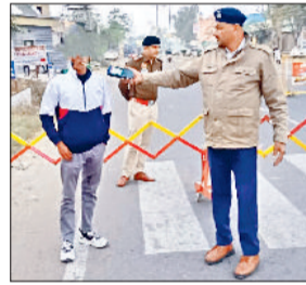
वाहन चालकों की जांच करते पुलिस कर्मी।

रोहतक। जिले में यातायात नियमों की सख्ती से पालना सुनिश्चित करने के लिए एक विशेष अभियान निरंतर चलाया जा रहा है। इसी कड़ी में पुलिस द्वारा 15 से 21 दिसंबर तक यातायात नियमों की अवहेलना करने वाले वाहन चालकों के खिलाफ विशेष अभियान चलाया गया। इस अभियान के तहत शराब पीकर वाहन चलाने, गलत दिशा अथवा गलत लेन में वाहन चलाने, अवैध रूप से वाहनों पर लाल/नीली बत्ती लगाने तथा साइलेंसर को मॉडिफाई कर पटाखा जैसी ध्वनि उत्पन्न करने वाले वाहन चालकों के खिलाफ सख्त कार्रवाई की गई। 15 से 21 दिसंबर तक चले इस अभियान में शराब पीकर वाहन चलाने वाले 56 वाहन