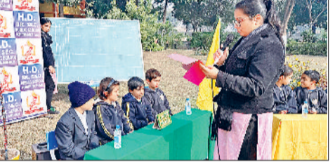
महम। गणित प्रतियोगिता में भाग लेते एचडी स्कूल खेड़ी महम के विद्यार्थी।