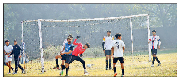
रोहतक। पुरुष फुटबॉल प्रतियोगिता में दमखम दिखाते खिलाड़ी।

पंडित नेकी राम शर्मा राजकीय महाविद्यालय में अंतर-महाविद्यालय पुरुष फुटबॉल टूर्नामेंट का भव्य आयोजन 23 दिसंबर 2025 से 24 दिसंबर 2025 तक किया जा रहा है। इस प्रतिष्ठित प्रतियोगिता में विभिन्न महाविद्यालयों की टीमों ने उत्साहपूर्वक भाग लिया और खिलाड़ियों ने उत्कृष्ट खेल भावना का प्रदर्शन किया। टूर्नामेंट का उद्देश्य छात्रों में खेल संस्कृति को बढ़ावा देना, शारीरिक दक्षता विकसित करना तथा प्रतिभाशाली खिलाड़ियों को आगे बढ़ने का अवसर प्रदान करना है। टूर्नामेंट के पहले दिन कुल तीन मुकाबले खेले गए। आज का पहला मैच यूनिवर्सिटी टीचिंग डिपार्टमेंट (यू.टी.डी.), महर्षि दयानंद विश्वविद्यालय और राजकीय